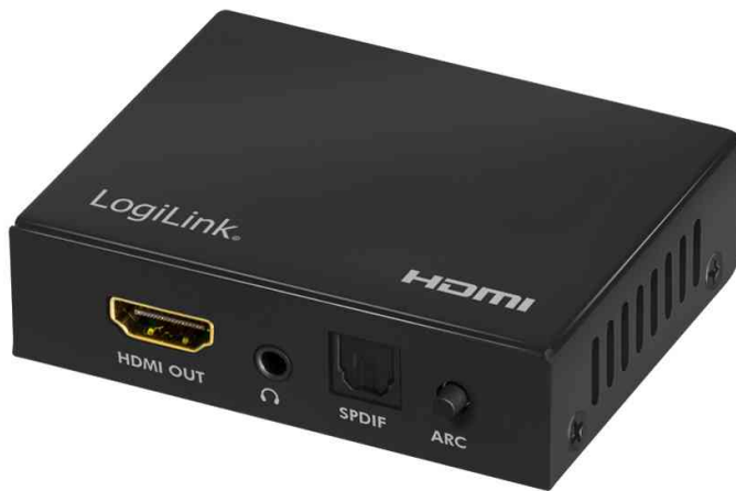
4K/60Hz HDMI Audio Extraktor, 2CH/5.1CH