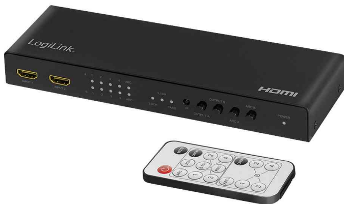
4K/60Hz HDMI Matrix Switch (4x2) mit Audio-Extraktor, Downscaler