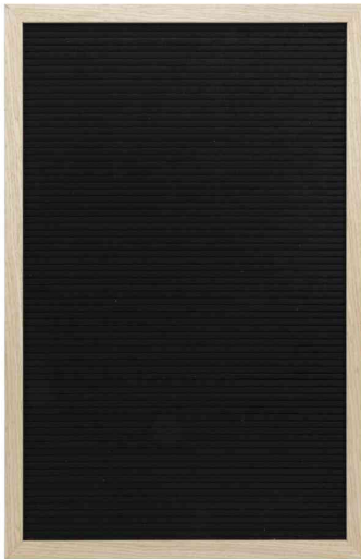
Wandtafel LETTER BOARD, 400 x 600 mm