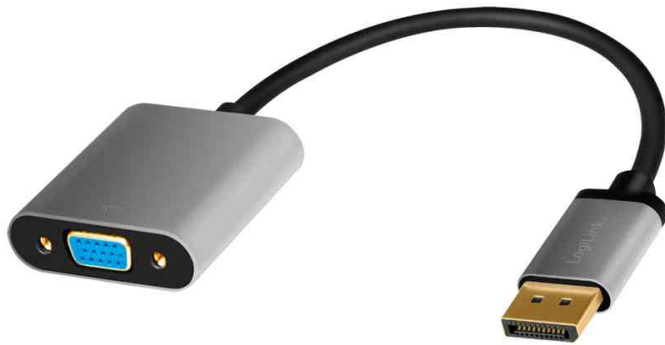
DisplayPort - VGA Adapterkabel

- ideal geeignet zum Betrieb von Beamer, TFT-, Plasma- oder LCD-TVs mit VGA-Anschluss an einem Macbook oder Macbook Pro von Apple