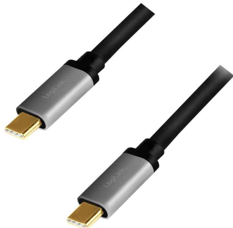
USB 3.2 (Gen2) Anschlusskabel, USB-C Stecker- USB-C Stecker

- ideal um externe USB-C-Geräte über den USB-C-Anschluss an einen PC oder Notebook anzuschließen