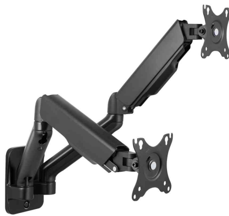
Doppel-Monitorarm zur Wandmontage