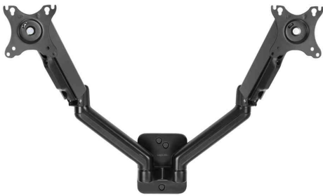
Doppel-Monitorarm zur Wandmontage