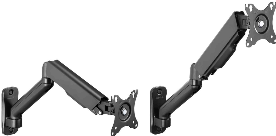
Monitorarm zur Wandmontage