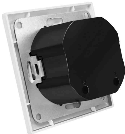
Unterputz-Steckdose mit 2x USB A, 1x USB C