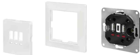
Unterputz-Steckdose mit 2x USB A, 1x USB C