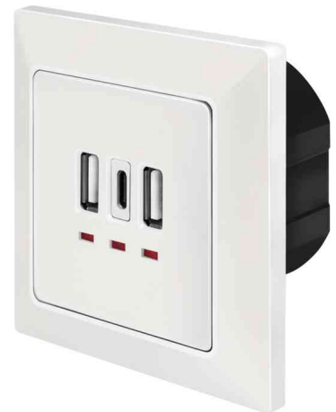
Unterputz-Steckdose mit 2x USB A, 1x USB C