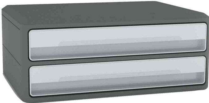
Schubladenbox MoovUp, 2 Schübe