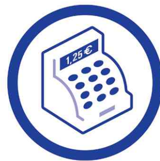
Ihre Vorteile auf einen Blick