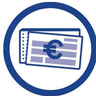
Ihre Vorteile auf einen Blick