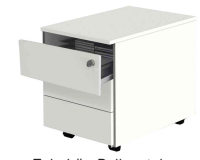
Zubehör: Rollcontainer N:\VivalP\Koepe\79837\4647.jpg