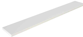
Zubehör: Taschenablage N:\VivalP\Koepe\79837\3968.jpg