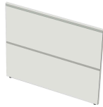
Zubehör: Seitenblende Atlantis 3 N:\VivalP\Koepe\79837\3299.jpg