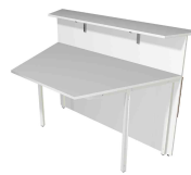
1) Grundtheke, 2-seitig schräg N:\VivalP\Koepe\79837\3270.jpg