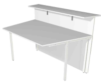
1) Grundtheke, 1-seitig schräg N:\VivalP\Koepe\79837\3269.jpg