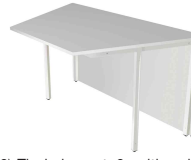
2) Tischelement, 2-seitig schräg N:\VivalP\Koepe\79837\3273.jpg