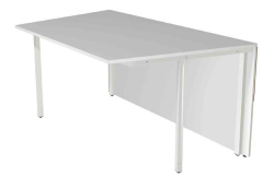
2) Tischelement, 1-seitig schräg N:\VivalP\Koepe\79837\3272.jpg