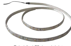
Zubehör: LED-Leuchtleiste N:\VivalP\Koepe\79837\3400.jpg