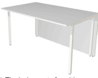
2) Tischelement, 2-seitig gerade N:\VivalP\Koepe\79837\3271.jpg