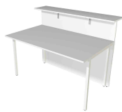
1) Grundtheke, 2-seitig gerade N:\VivalP\Koepe\79837\3268.jpg