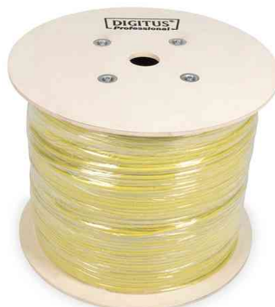
Verlegekabel Kat.7A, S/FTP, Duplex, Trommel