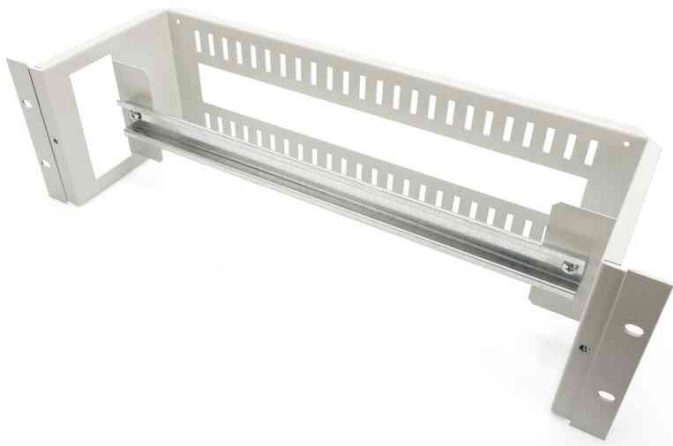
19" Hutschienenträger, 3HE