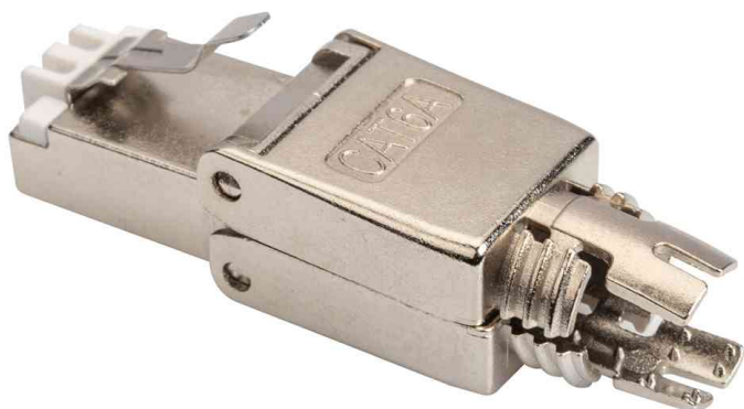
Feldstecker Kat. 6A, geschirmt