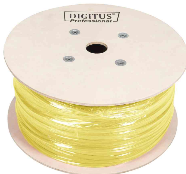
Twisted Pair Installationskabel Kat. 7A, Duplex, Trommel