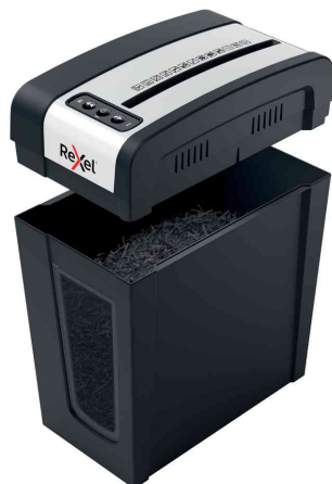
Aktenvernichter Secure MC4-SL Slim Line, offen