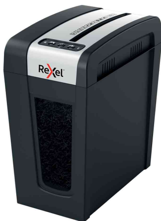
Aktenvernichter Secure MC4-SL Slim Line