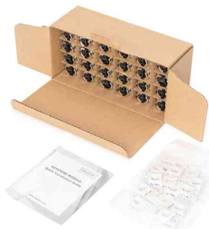
Keystone Modul Kat. 6A, Lieferumfang