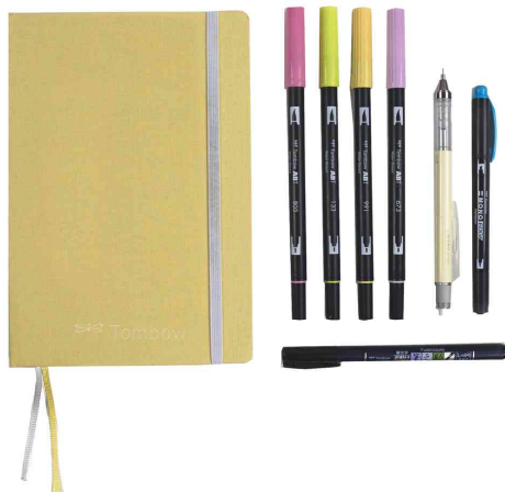
Creative Journaling Kit BRIGHT, Inhalt