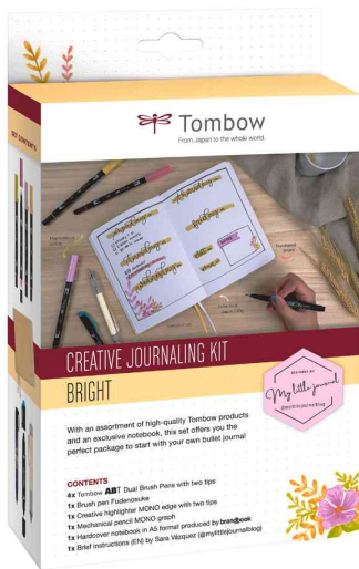
Creative Journaling Kit BRIGHT