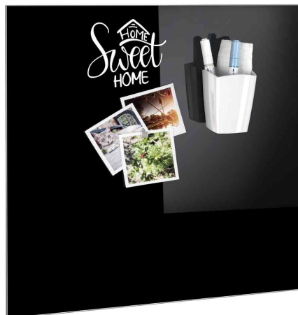
Stifteköcher GLASS BOARD weiß, Anwendungsbeispiel