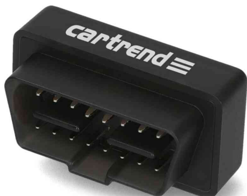
Diagnosegerät WIFI OBD II