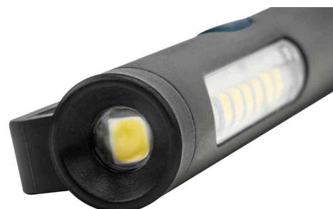
zusätzliches Spotlight am Lampenkopf