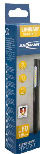
Professionelle LED Stiftleuchte PL130B, in Verpackung