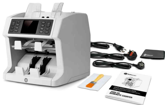
Lieferumfang von Geldschein-Zählgerät "Safescan 2985-SX"