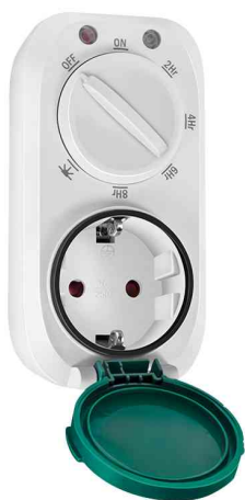
Mechanische Zeitschaltuhr mit Dämmungssensor, IP44