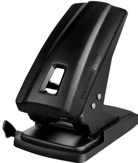
Locher Essentials E4044