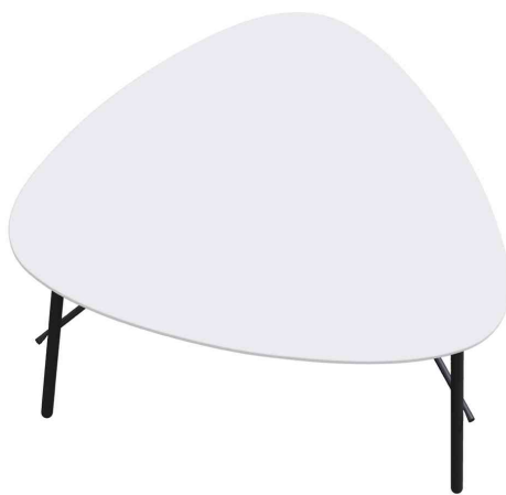
Beistelltisch LAZY, (B)605 x (H)500 mm, weiß