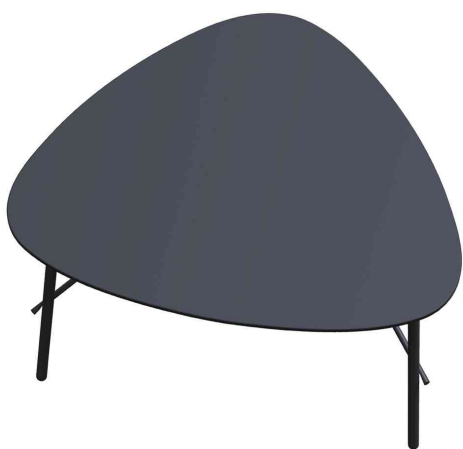
Beistelltisch LAZY, (B)605 x (H)500 mm, schwarz