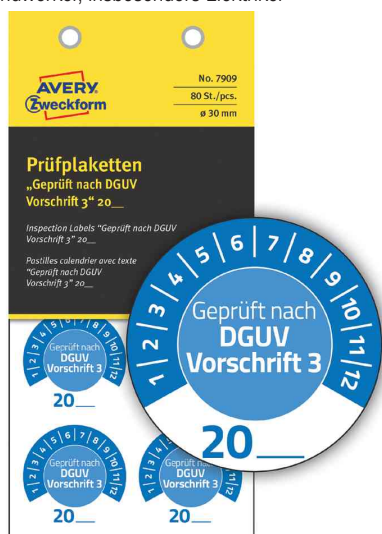
Prüfplaketten "DGUV Vorschrift 3", blau