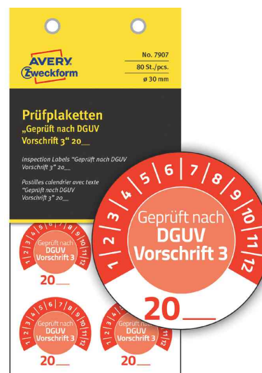
Prüfplaketten "DGUV Vorschrift 3", rot