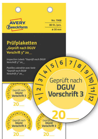
Prüfplaketten "DGUV Vorschrift 3", gelb