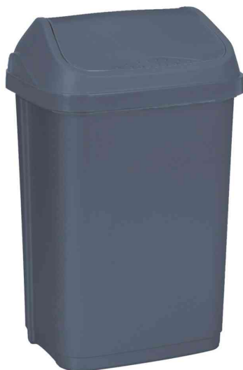
Abfalleimer "swantje eco", grau