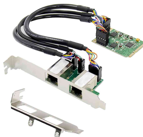
Dual Gigabit Ethernet Mini PCI Express Karte