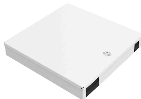
LWL-Spleißbox Unibox, Medium