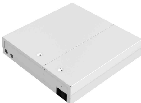
LWL-Spleißbox Unibox, Maxi