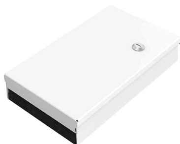
LWL-Spleißbox Unibox, Kompakt

Medium: für bis zu 48 Fasern • Maße: (B)320 x (T)54 x (H)445 mm • Gewicht: 5.200 g