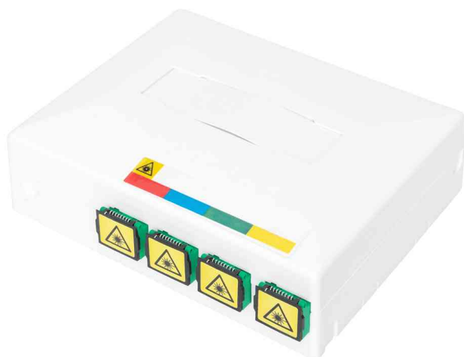
FTTX Leergehäuse mit 4 x SC SX Kupplung