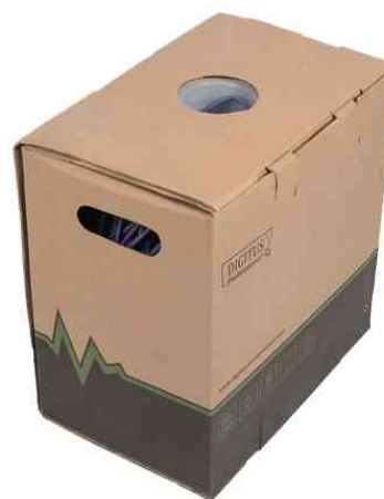
Installationskabel Kat. 6, F/UTP, LSZH-1, Verpackung