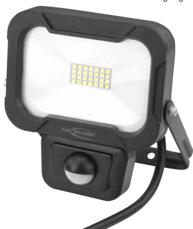
LED-Wandstrahler LUMINARY WFL800S