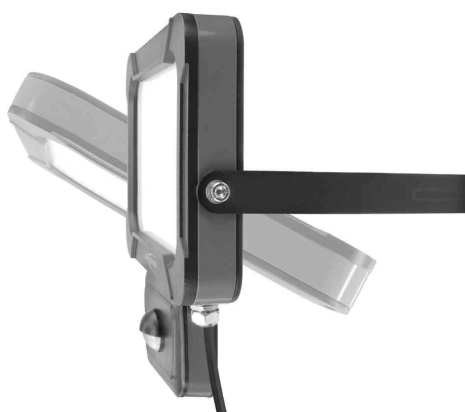
LED-Wandstrahler LUMINARY WFL800S, Seitenansicht