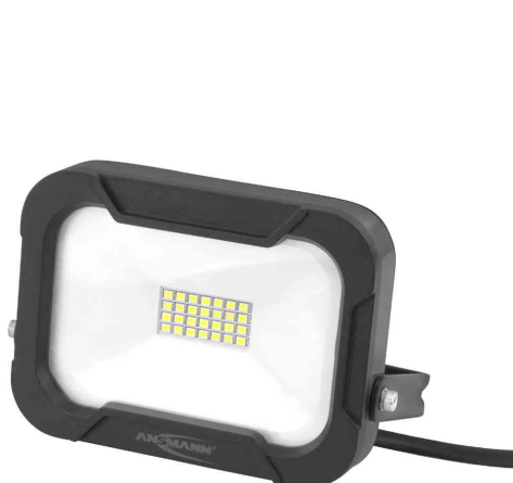
LED-Wandstrahler LUMINARY WFL800