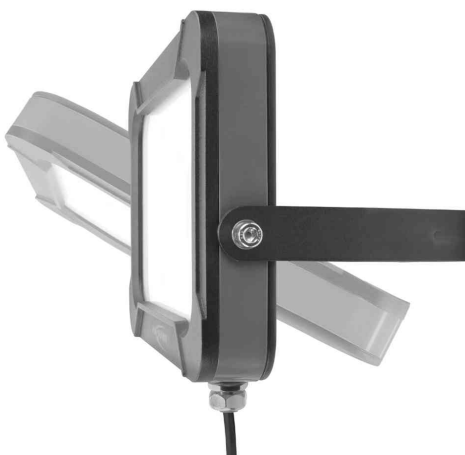
LED-Wandstrahler LUMINARY WFL2400, Seitenansicht