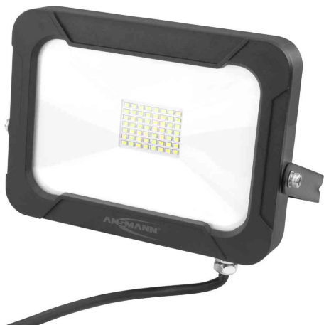
LED-Wandstrahler LUMINARY WFL2400