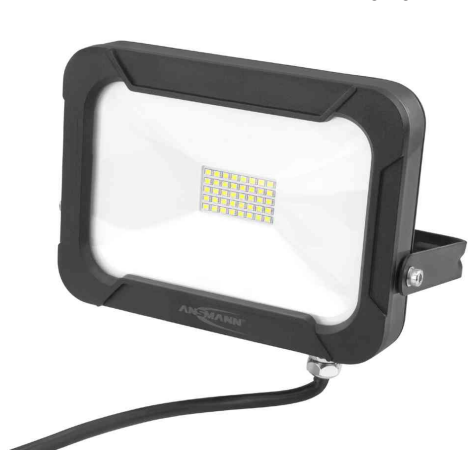
LED-Wandstrahler LUMINARY WFL1600