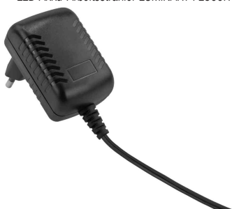
Netzteil mit Eurostecker