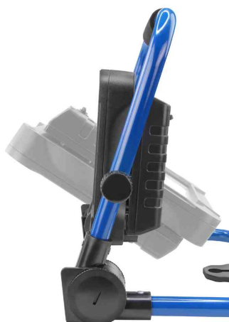
LED Akku-Arbeitsstrahler LUMINARY FL800R, Seitenansicht