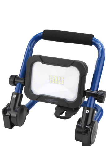
LED Akku-Arbeitsstrahler LUMINARY FL800R