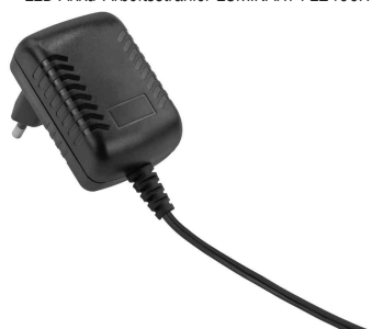
Netzteil mit Eurostecker