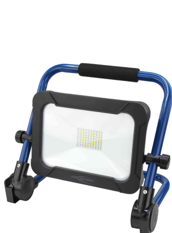
LED Akku-Arbeitsstrahler LUMINARY FL2400R