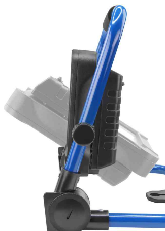
LED Akku-Arbeitsstrahler LUMINARY FL2400R, Seitenansicht