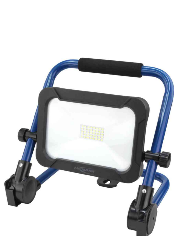
LED Akku-Arbeitsstrahler LUMINARY FL1600R