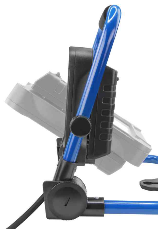
LED-Arbeitsstrahler LUMINARY FL800AC, Seitenansicht