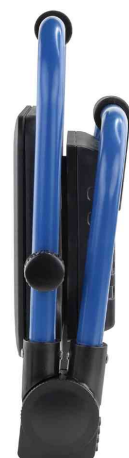
LED-Arbeitsstrahler LUMINARY FL800AC, zusammenklappbar