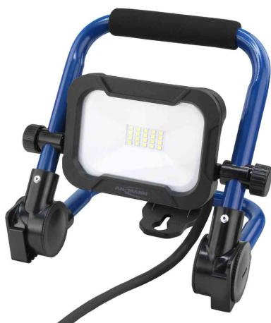
LED-Arbeitsstrahler LUMINARY FL800AC