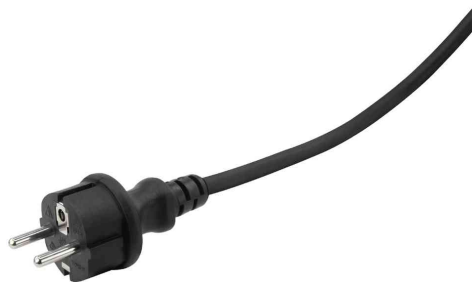
mit integriertem H07RN-F Gummikabel