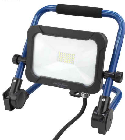
LED-Arbeitsstrahler LUMINARY FL1600AC