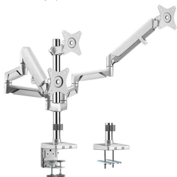
Dreifach-Monitorarm aus Aluminium