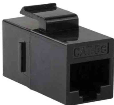
Keystone Verbinder Kat.5e, Klasse D, ungeschirmt