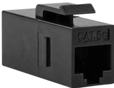
Keystone Verbinder Kat.5e, Klasse D, ungeschirmt