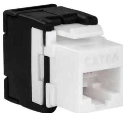
Keystone Modul Kat.6A, Klasse EA, ungeschirmt