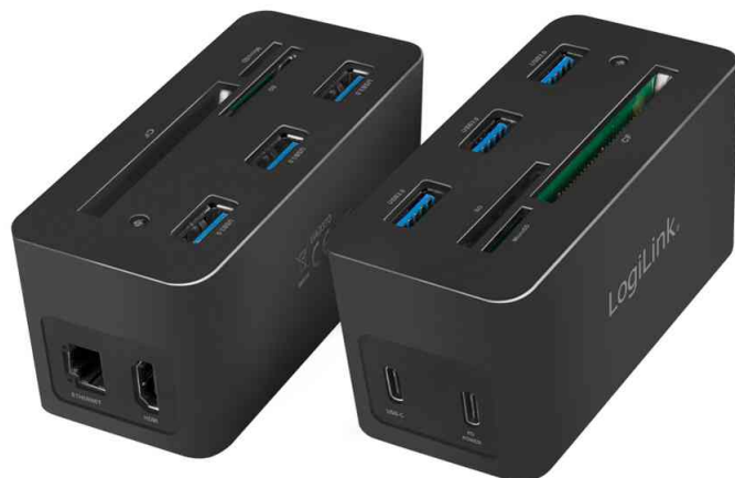
USB 3.2 (Gen 1) Mini Docking Station, 10-Port

Lieferumfang: USB 3.2 (Gen 1) Mini Docking Station, USB-C Kabel und Bedienungsanleitung