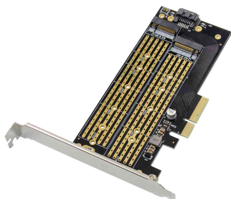
M.2 NGFF NVMe SSD PCI Express 3.0 (x4) Add-On Karte