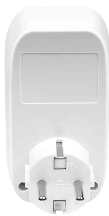
Adapterstecker mit Bewegungssensor, Rückansicht