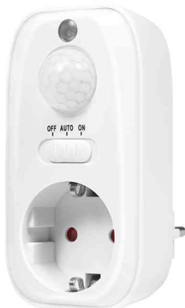
Adapterstecker mit Bewegungssensor