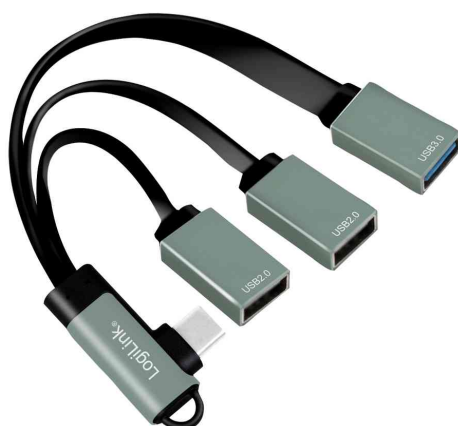
USB-C Hub mit gewinkeltm Stecker