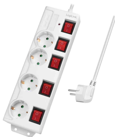
Steckdosenleiste, 4-fach mit 5 Schaltern, weiß