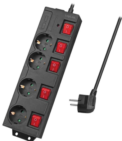
Steckdosenleiste, 4-fach mit 5 Schaltern, schwarz