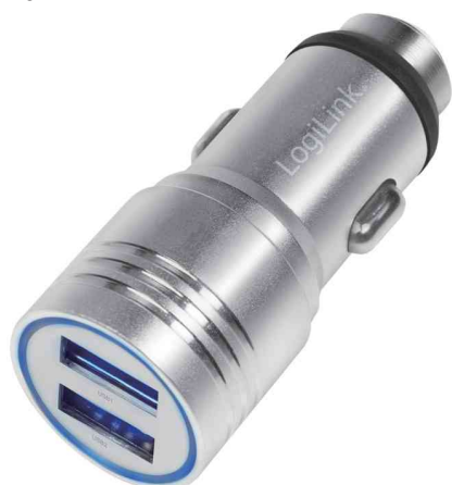
USB-KFZ-Ladegerät, 2-fach, mit integriertem Nothammer